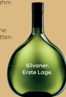
Silvaner. Erste Lage.

Belag: + 500 g Spargel + 150 g Ziegenfrischkäse + 150 g Sauerrahm + 1 Ei + 1 Bio-Zitrone + 1 EL Zucker + 1 TL Salzzitrone klein geschnitten + Pfeffer